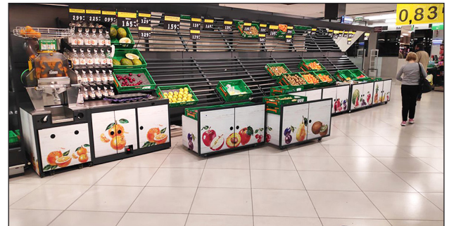
▲ Un establecimiento de Mercadona en los primeros días del estado de alarma

¿Por qué se ha agotado el papel higiénico en muchos supermercados? ¿Qué es el efecto de bola de nieve? | ¿Crees que es sensato abastecerse copiosamente?