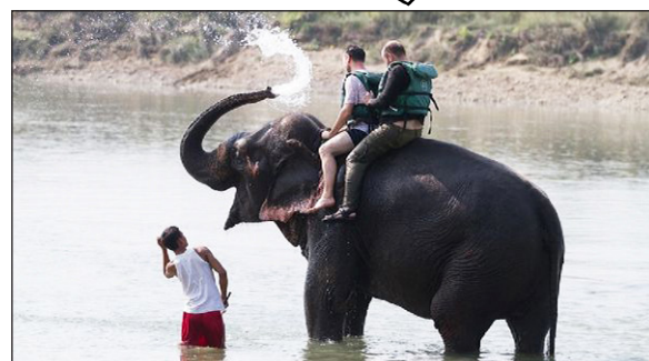
▲ Un elefant passeja dos turistes

TAILÀNDIA ÉS UN PAÍS ASIÀTIC 1 QUE REP MOLTS TURISTES. SOLEN VISITAR UNS PARCS ON HI HA ELEFANTS. AQUESTS PARCS HAN REBUT MOLTES CRÍTQUES, PERQUÈ ELS ANIMALS PATEIXEN. ELS SEPAREN DE LES MARES QUAN SÓN PETITS, ELS DOMESTIQUEN 2 I ELS OBLIGUEN A PASSEJAR TURISTES SOBRE L'ESQUENA O A FER ESPECTACLES D'ACROBÀCIES. 3