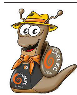
▲ Hèlix, la mascota de l'Aplec

aplec: trobada de persones que celebren una festa.