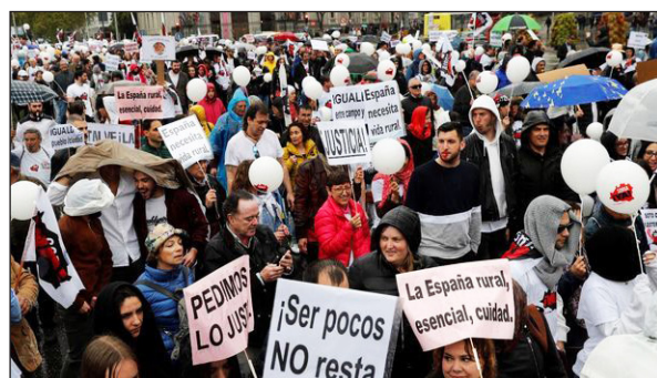
▲ Manifestación en Madrid

Por eso, una gran manifestación en Madrid ha reunido a los habitantes de la llamada «España vaciada», que piden soluciones a los políticos. Quieren recibir todos los servicios que necesitan para no terminar desapareciendo. Unidos, esperan tener más fuerza para que se los escuche.