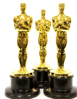
▲ Estatueta dels Oscar

Per què ha cridat l'atenció que una pel·lícula sud-coreana guanyés premis importants? | Quina ha estat una de les actuacions de la gala? Per què podria ser bo que veiéssim cinema de molts països diferents?