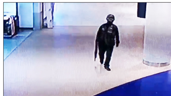
▲ El militar captado por las cámaras de vigilancia del centro comercial

Tailandia ha vivido un ataque en un centro comercial. Un militar de 32 años robó munición, armas y un coche en su caserna y luego se fue a un gran centro comercial. Durante el trayecto y también dentro del centro, empezó a disparar. Publicaba imágenes del ataque en su cuenta de Facebook, por lo que se la cerraron.