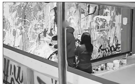
▲ Moment en què els joves van pintar sobre el grafit

Què va passar amb un grafit? | Com va acabar la història dels dos joves? | T'agrada veure grafits a les parets i les portes? Per què?