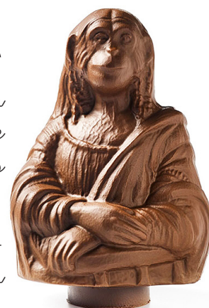
▲ La Mona Lisa de xocolata

Com va anar la venda de mones l'any passat i com ha anat enguany? | Quines mones han destacat per Pasqua? | Per què penses que se'n solen fer moltes amb personatges de dibuixos animats o pel·lícules?