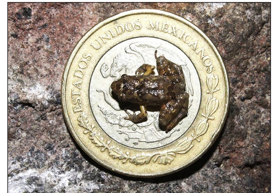
▲ Una de les granotes sobre una moneda d'un pes mexicà.

Què s'ha descobert als boscos de Mèxic? | Quina mida tenen aquestes minigranotes? | Si fossis científic, què t'agradaria descobrir? Per què?