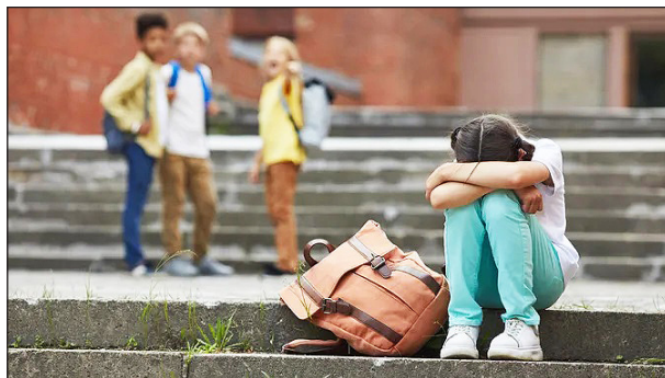
▲ Grup de nens burlant-se d'una nena

Què és l'assetjament escolar? | Quina és una de les propostes per frenar-lo? | Creus que entre tots es pot resoldre aquest problema? Com?