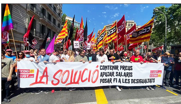
▲ Capçalera de la manifestació a Barcelona

L'1 de maig és el Dia Internacional del Treball, creat per demanar que les condicions de feina siguin justes, per exemple, en horaris, salaris i seguretat.