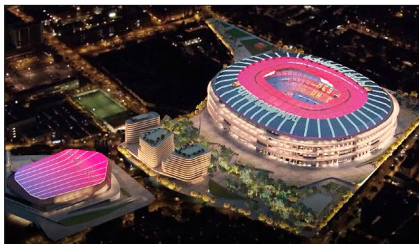
▲ Maqueta del nou Camp Nou.

Ja fa temps que a l'estadi del Barça, inaugurat el 1957, li cal una reforma. Després que al desembre els socis aprovessin el finançament del projecte, ara el Barça ha arribat a un acord amb l'Ajuntament de Barcelona per obtenir la llicència d'obres de l'Espai Barça, que és el nom que tindrà tot l'espai blaugrana.