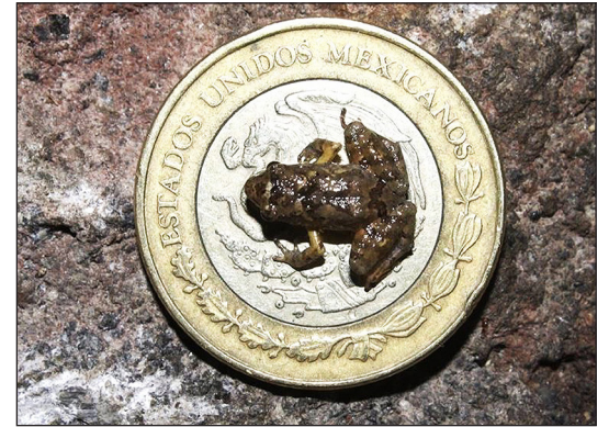
▲ Una de les granotes sobre una moneda d'un pes mexicà.

Què s'ha descobert als boscos de Mèxic? | Quina mida tenen aquestes minigranotes? | Si fossis científic, què t'agradaria descobrir? Per què?