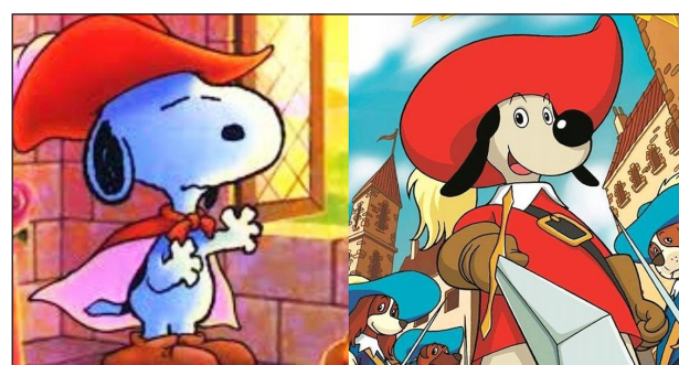
▲ Snoopy i D'Artacan

Una d'aquestes curiositats és sobre D'Artacan , la història d'un espadatxí que lluita per la justícia a París. A la sèrie, els personatges són gossos, i Biern ha revelat que per fer-los es va inspirar en el famós Snoopy, el beagle protagonista