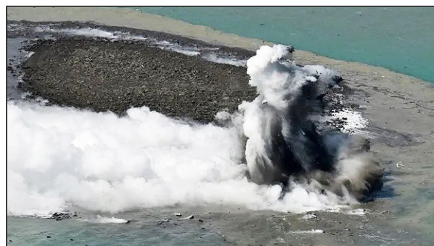
▲ Columna de fum i explosió de roques que van formant l'illot

Els experts han explicat que es tracta d'un volcà submarí que ha entrat en erupció. ■ Durant setmanes, ha anat expulsant roques i lava que s'han anat escampant al voltant. De moment, s'hi ha format un illot de la llargada d'un camp de futbol.